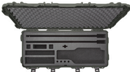
TAKEDOWN foam insert Insert de mousse TAKEDOWN