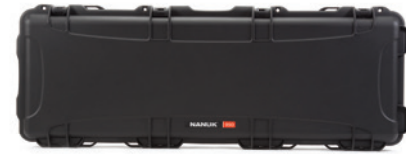
990 | 990 AR15

Interior dimensions L44.0" × W14.5" × H6.0" Dimensions intérieures L1118mm × W368mm × H152mm