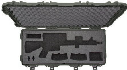
AR15 foam insert Insert de mousse AR15