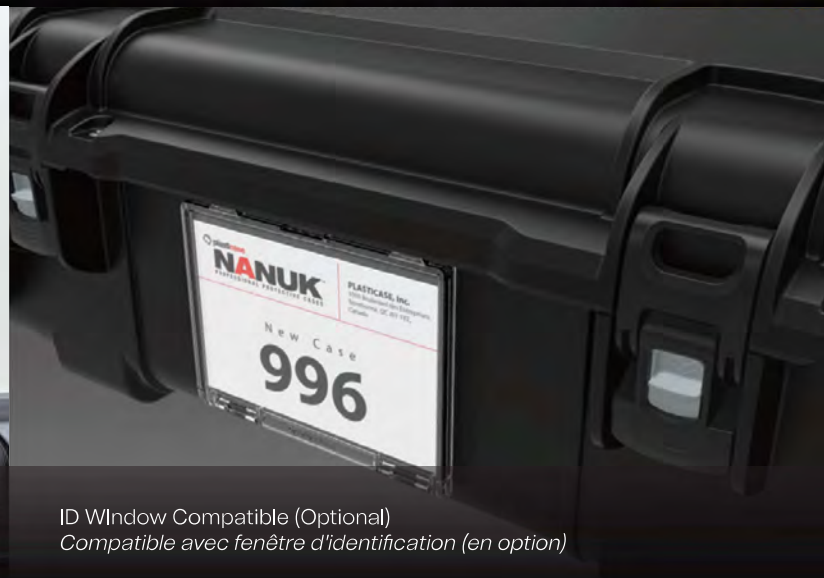
ID Window Compatible (Optional) Compatible avec fenêtre d'identification (en option)