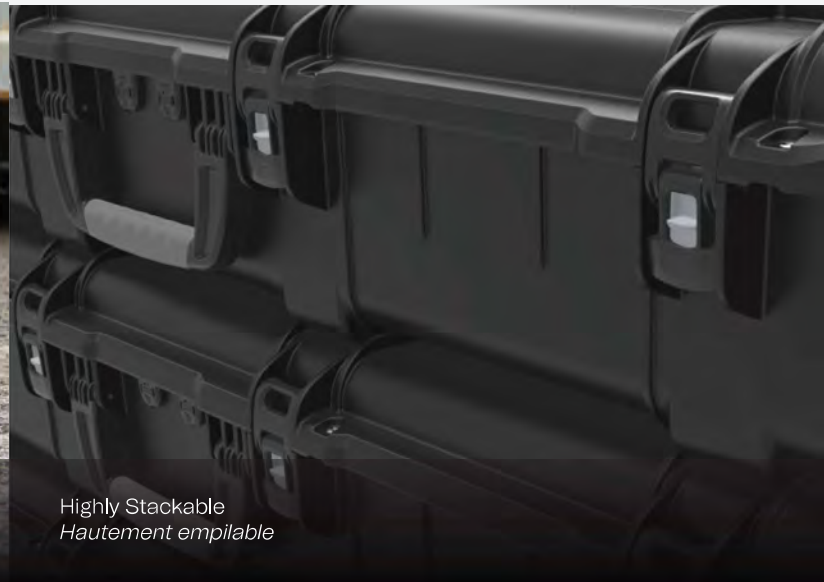
Highly Stackable Hautement empilable