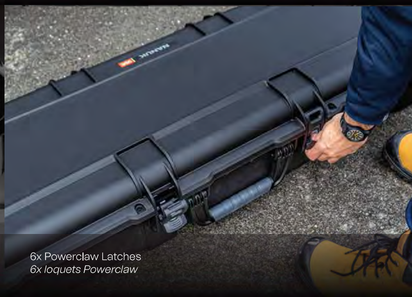
6x Powerclaw Latches 6x loquets Powerclaw