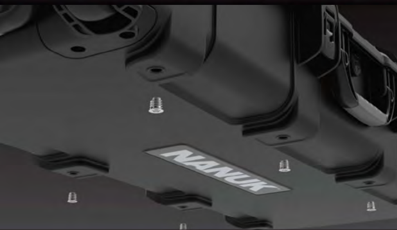
8x M8 Threaded Steel Inserts 8x inserts filetés en acier M8