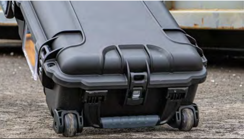
2 Large and Strong Polyurethane Wheels 2 grandes et solides roues en polyuréthane